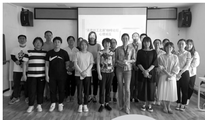
美井社工之家活动开启

8月24日下午，为了帮助社区工作者缓解压力、舒缓情绪，建立理性平和、积极向上的社会心态，双井街道组织18个社区工作者，举办以“放松身心 轻快前行”为主题的心理减压活动。