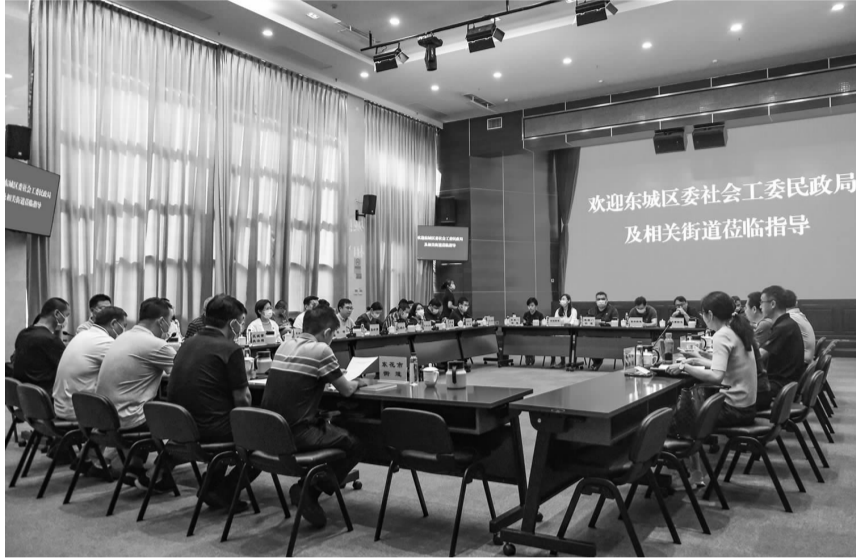
一行人在双井街道召开座谈会

首先,调研组一行来到双井街道市民诉求中心,听取综合执法平台调度、应急管理体系、网格化城市管理、大数据智能治理系统、“党统六网”接诉即办工作模式以及建立“井”字督导监督网等工作汇报。