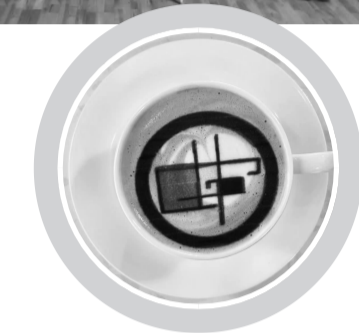
场制作的咖啡 社区工作者和居民现

结束后，组织社工参与体验国际化社区咖啡体验课程，与地区居民共同进行“中外文化交流”。